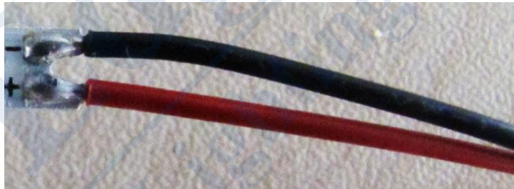
连接方式二 Two Connection mode