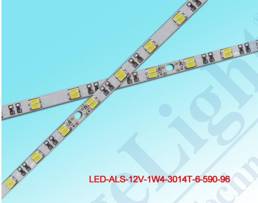
连接方式一 One Connection mode